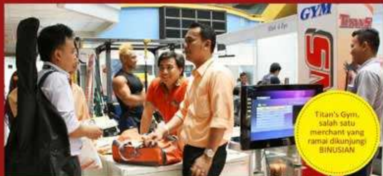
Titan's Gym, salah satu merchant yang ramai dikunjungi BINUSIAN