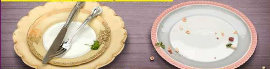
Table manner atau etika makan dipakai untuk mengatur tata cara saat bersantap di meja makan. Aturan ini diperkenalkan bangsa Eropa. Walaupun terdapat aturan dasar yang sama, table manner berbeda antara satu budaya dengan budaya lainnya.

Oleh: Hera Oktadiana | Hospitality and Tourism Management BINUS International