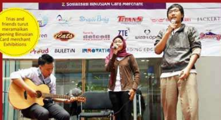
Trias and friends turut meramaikan opening BINUSIAN Card merchant Exhibitions